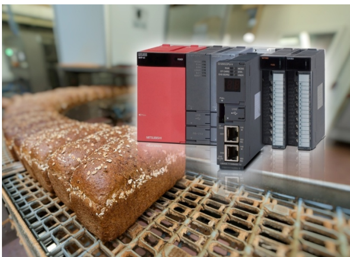
Фото 2: С помощью стандартных компонентов автоматизации, таких как интерфейсный модуль MES-IT от Mitsubishi Electric, можно быстро достичь необходимой прозрачности, а также экономии даже в производстве хлебобулочных изделий.