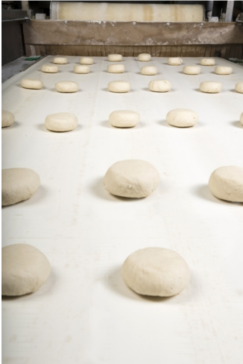
Фото 4: Общая производительность оборудования может быть существенно увеличена путем объединения изолированных решений с использованием эффективных и снижающих затраты технологий.