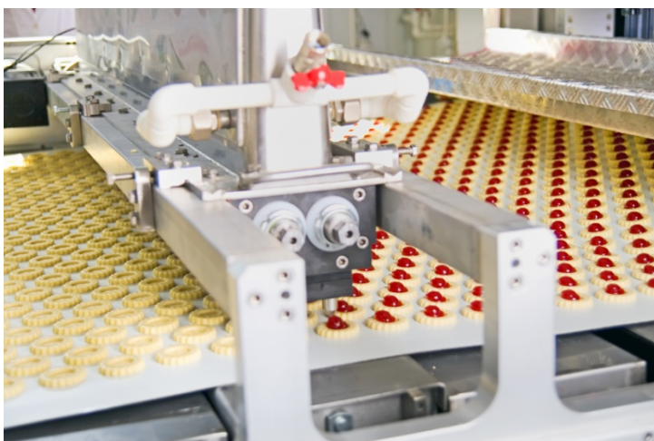
Фото 3: Надежность характеристик, сбор и точный анализ данных технологического процесса и производства, обеспечивают необходимую прозрачность.

Фото 2: С помощью стандартных компонентов автоматизации, таких как интерфейсный модуль MES-IT от Mitsubishi Electric, можно быстро достичь необходимой прозрачности, а также экономии даже в производстве хлебобулочных изделий.