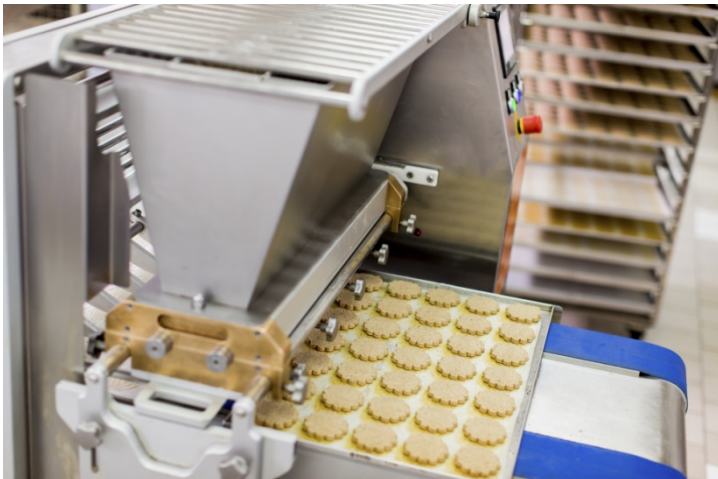
Фото 5: Автоматизация, даже в пекарной промышленности, может существенно повысить долгосрочную стабильность новых систем, а также систем, которые расширились на протяжении многих лет.

Фото 4: Общая производительность оборудования может быть существенно увеличена путем объединения изолированных решений с использованием эффективных и снижающих затраты технологий.