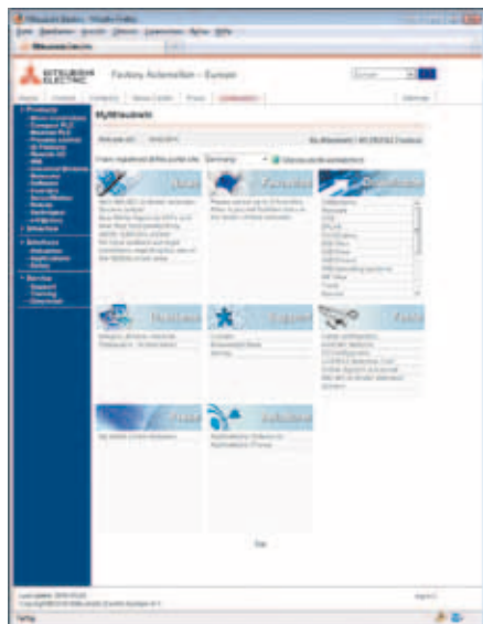
Раздел "Для партнеров" содержит много ценной сервисной информации.

Раздел "для партнеров" содержит богатый материал, в том числе более 11 000 документов по всем продуктам, плюс более 27 000 часто задава-