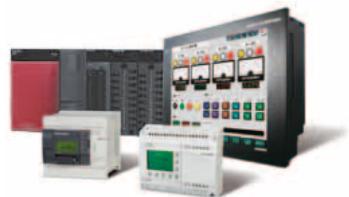
В программу включены контроллеры и панели оператора.

Однако без надежности любые достижения немного стоят. Без надежности о глобальном лидерстве можно только мечтать. Вот почему Mitsubishi Electric вводит трехлетнюю гарантию на свои панели оператора и контроллеры*. С этого времени, выбирая оборудование Mitsubishi, вы получаете дополнительную уверенность в своих инвестициях. Гарантийные преимущества действительны и для экономического контроллера Alpha, и для комплексной станочной автоматической линии, построенной на платформе iQ Platform с несколькими панелями оператора GOT.