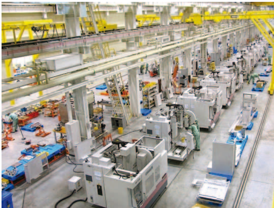
Производительность, на которую можно положиться.