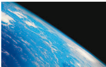
Выиграйте от сотрудничества с глобальным лидером.

Mitsubishi Electric – хорошо известный производитель средств автоматизации, предлагающий уникальную по производительности и надежности технику. От этих систем зависит существование глобального парка установленных устройств нашего производства – десятки миллионов модулей – и бесчисленных заводов во всем мире. Мы внедрили в промышленность целый ряд инноваций: от первого цифрового преобразователя частоты до первого компактного ПЛК. Мы продолжаем вводить новшества, предлагая нашим клиентам разнообразие патентованных технологий, например, подавление вибрации в режиме реального времени в наших системах позиционирования.