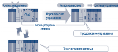
При сбое переключение на резервную систему происходит в течение всего 22 мс.

Основой резервированной конфигурации System Q являются два отдельных ЦП управления процессом (QnPRH), связанных между собой и выполняющих функции активной и резервной систем. Конфигурации обеих систем идентичны, что обеспечивает полностью резервированный состав и позволяет их устанавливать одним из двух способов.