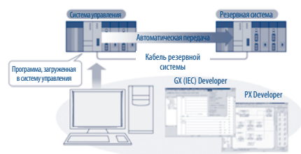
Резервированная система System Q автоматически синхронизирует программы между двумя системами.

Каждую систему System Q можно спроектировать с необходимой для данного при-